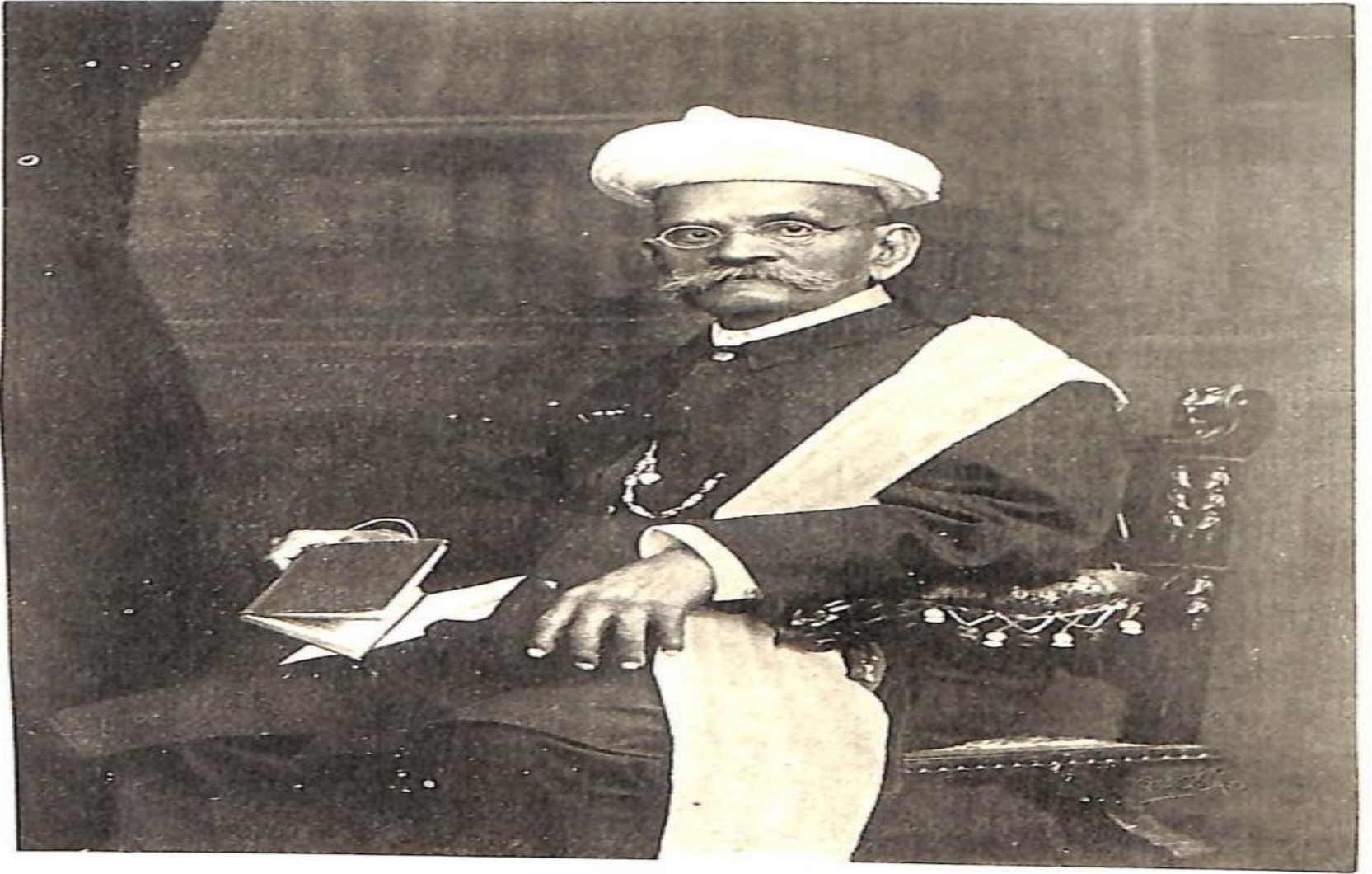
रामकृष्ण गोपाळ भांडारकर